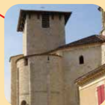
Eglise du XII e à Vertheuil