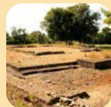
Site archéologique de Brion à Saint-Germain d'Esteuil