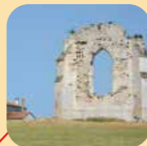
Vestiges de l'abbaye de l'Isle à Ordonnac