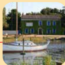
Petit port de la Maréchale à Cadoume